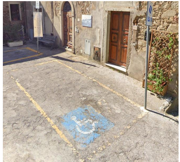
4 Parcheggio pubblico Piazza Stefani

Progetto realizzato con il contributo della