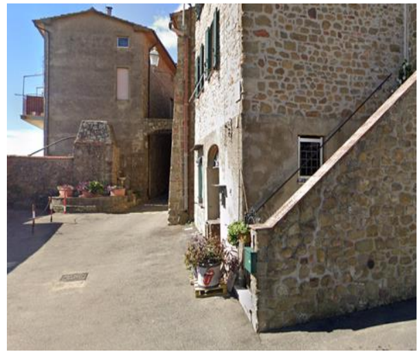
22 Ingresso area Mura ciclopiche

Progetto realizzato con il contributo della