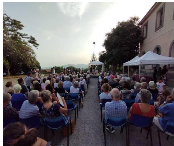
34 Conferenza all'aperto delle notti dell'archeologia