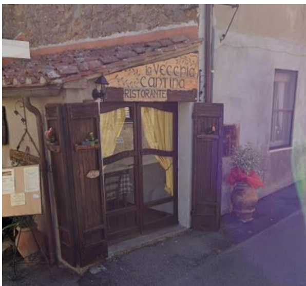
35 ingresso La vecchia Cantina