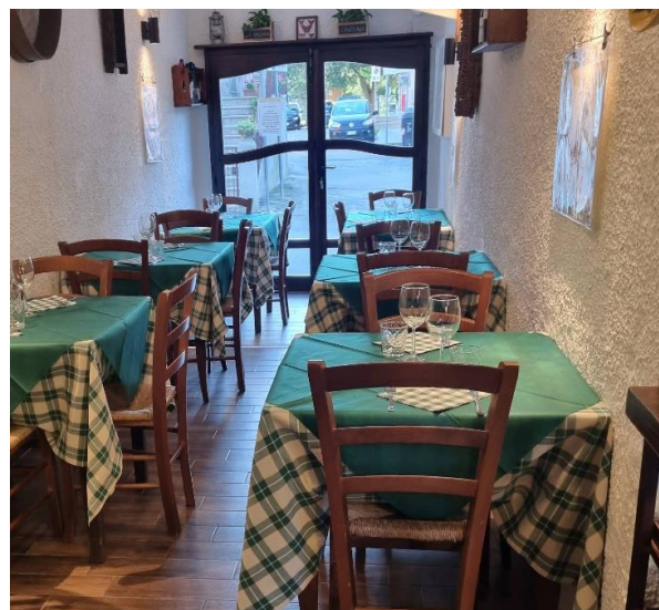
36 tavoli interni ristorante