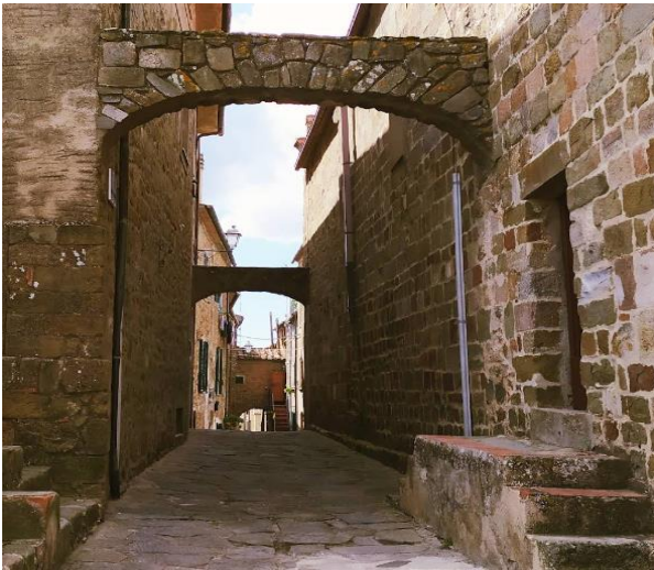
19 vicolo con archi