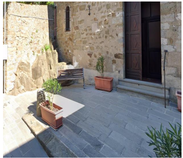
16 ingresso chiesa S. Simone e Giuda

Progetto realizzato con il contributo della