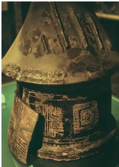
11 Reperto etrusco