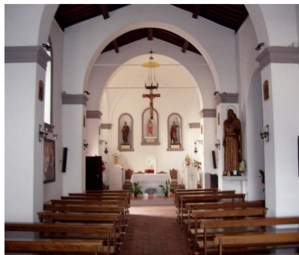
18 altare centrale

Da Piazza della Chiesa si prosegue avanti, attraversando una serie di archi che poggiano sugli edifici laterali e su una pavimentazione in blocchi di pietra.