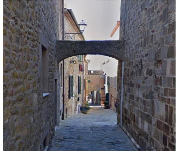
20 vicolo caratteristico con arco