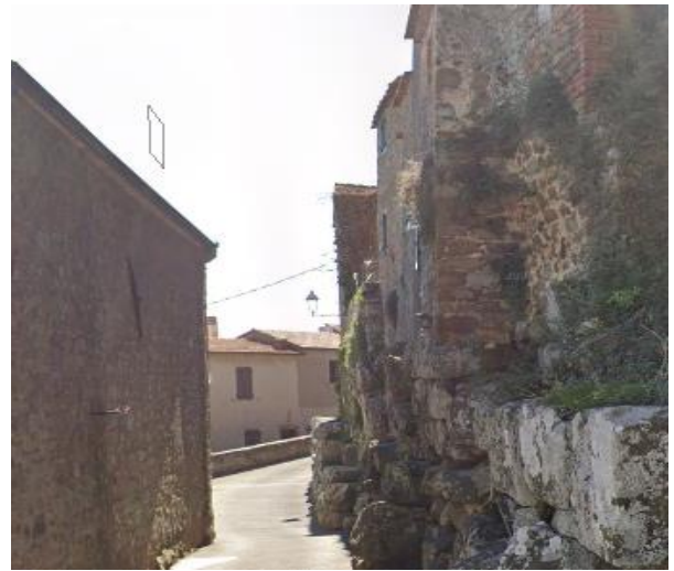
26 ultimo tratto Mura ciclopiche

Progetto realizzato con il contributo della