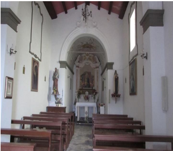
25 altare centrale e interni dell'Oratorio di Santa Maria delle grazie