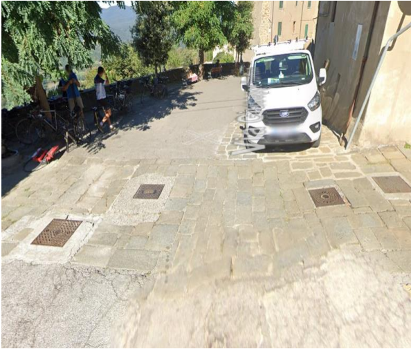
13 ingresso Piazza Stefani