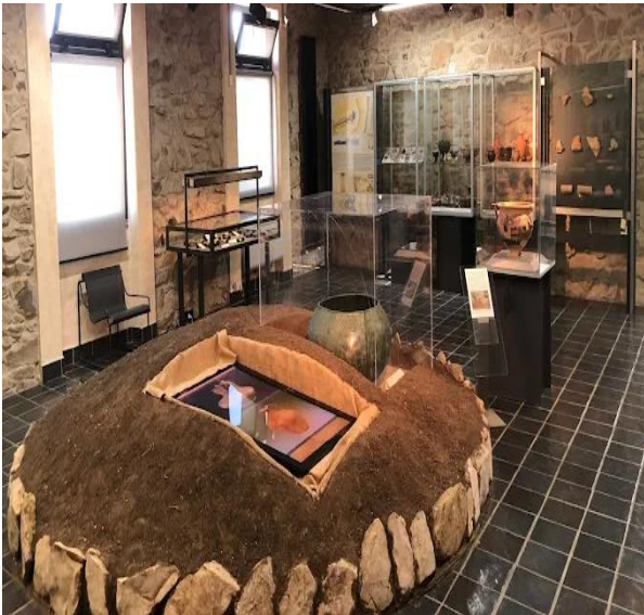
9 oggetti esposti al Museo