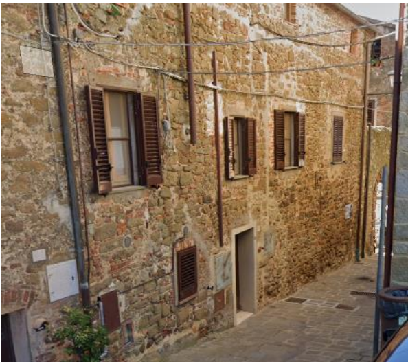
15 vicolo caratteristico