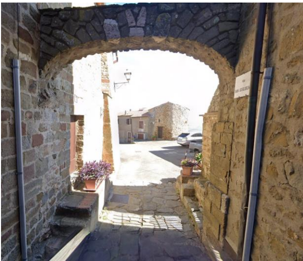
21 ultimo tratto del vicolo