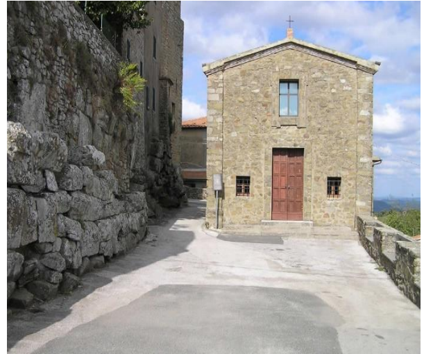
24 Facciata oratorio Santa Maria delle Grazie