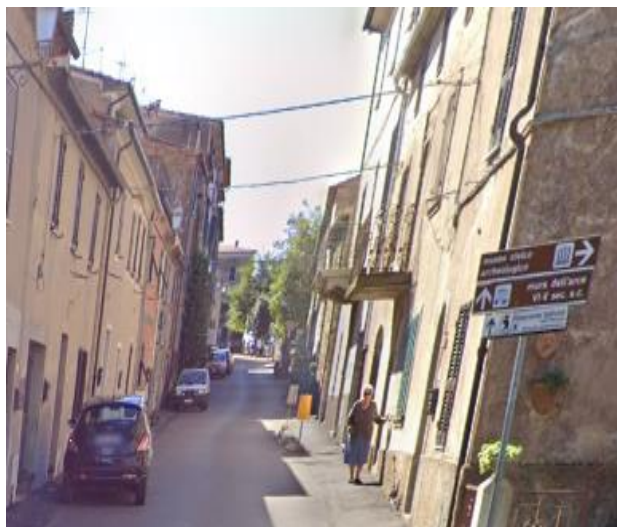
5 Percorso dal parcheggio di Piazza Vatluna a Piazza Stefani- primo tratto