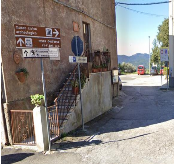
1 Ingresso Parcheggio Piazza Vatluna