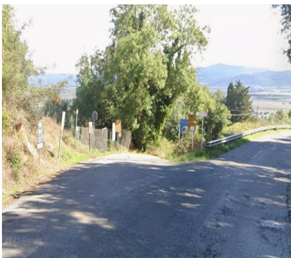
31 ingresso via dei Sepolcri