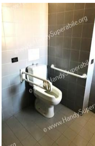
38 wc e maniglioni