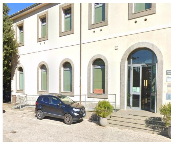
8 Rampe di ingresso al Museo