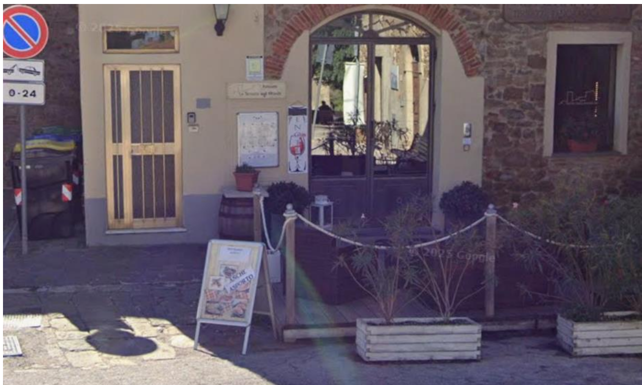
37 ingresso ristorante la terrazza degli etruschi