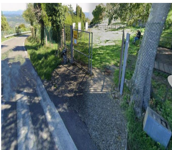
29 ingresso Scavi in città

L'area Scavi in città è parzialmente accessibile solo all'ingresso e con accompagnatore. Si consiglia di visitare la Via dei Sepolcri in auto.