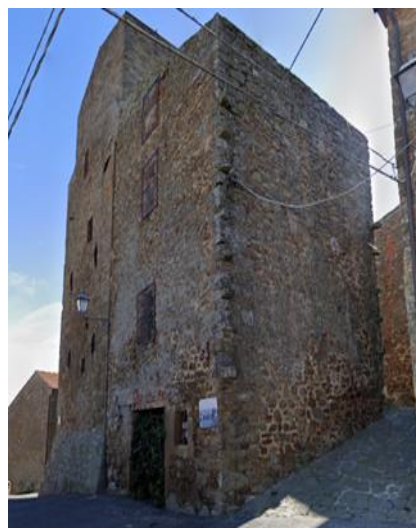
28 Torre a pianta quadrata