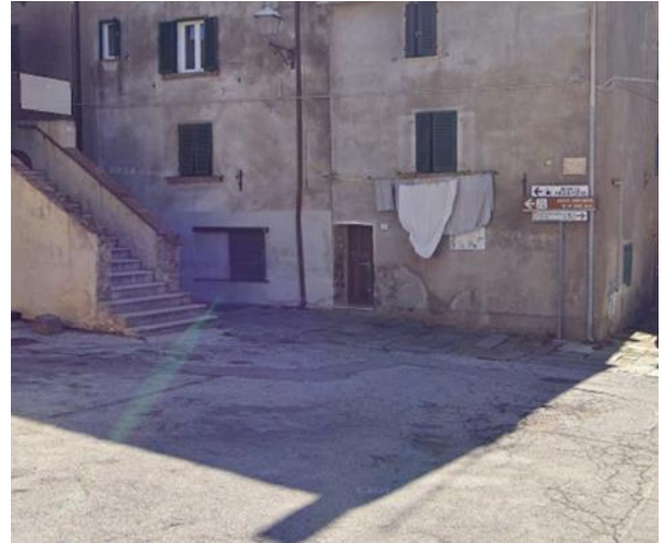
14 inizio percorso per mura ciclopiche