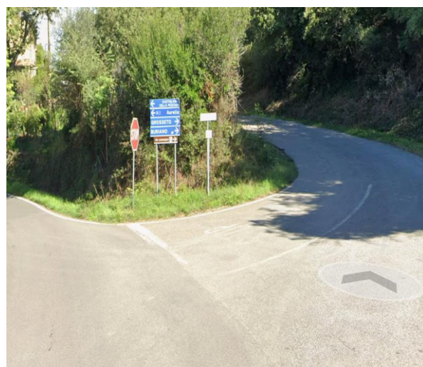
30 bivio per via dei Sepolcri – area archeologica