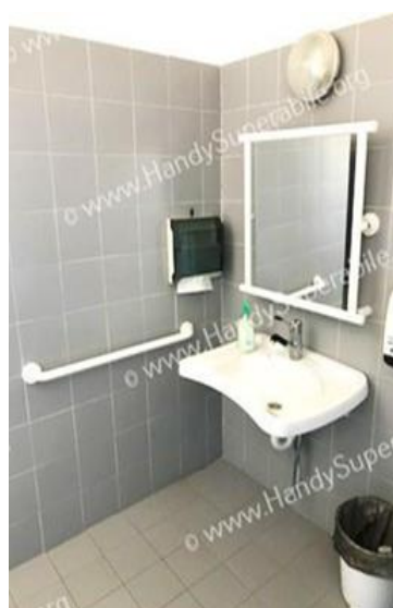
39 lavabo e specchio reclinabile

Progetto realizzato con il contributo della