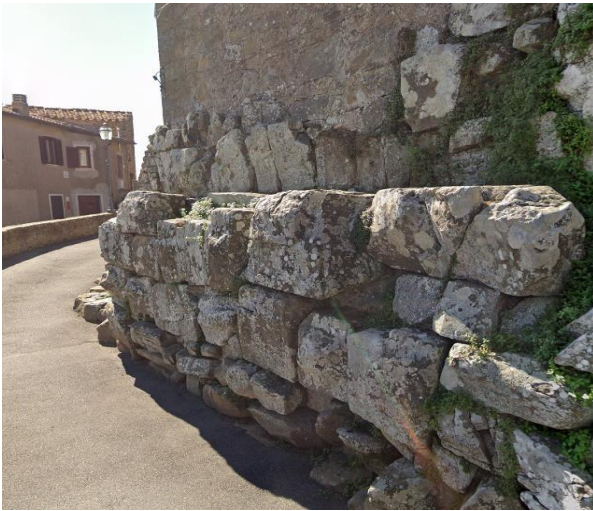
23 mura ciclopiche etrusche