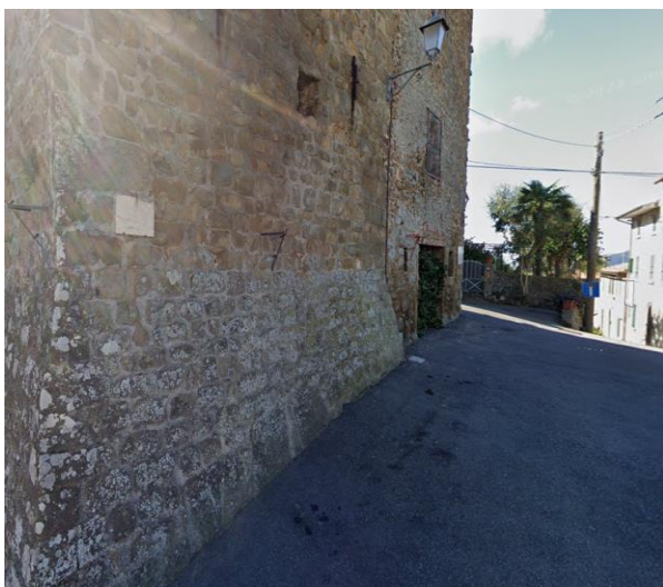
27 fortificazione medioevale