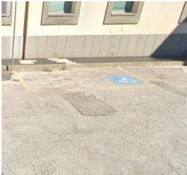
3 Parcheggio riservato Piazza Vatluna