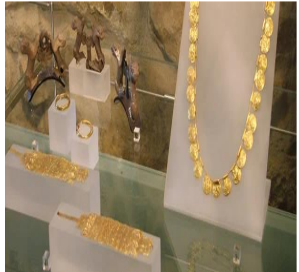
10 gioielli esposti al Museo