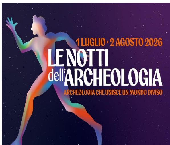
33 Locandina le notti dell'archeologia