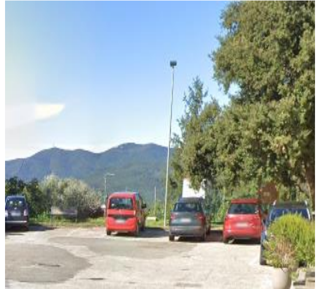
2 Parcheggio pubblico Piazza Vatluna