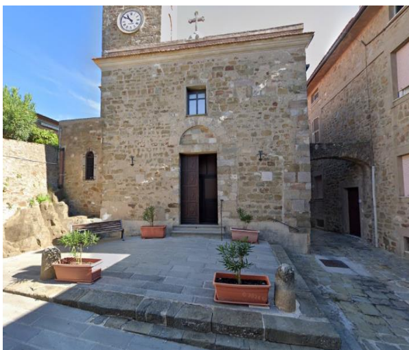
17 facciata esterna chiesa