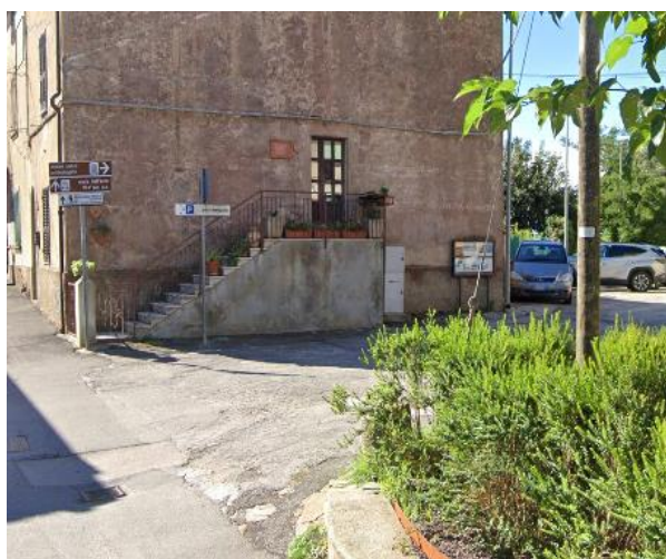
7 ingresso parcheggio Piazza Vatluna

Le 7 sale disposte su 2 piani, sono raggiungibili con ascensore, con larghezza utile della porta cabina di 86 cm, dimensioni interne cabina: larghezza di 137 cm x prof. 150 cm e pulsantiera con il pulsante più alto posto a 95 cm da terra.