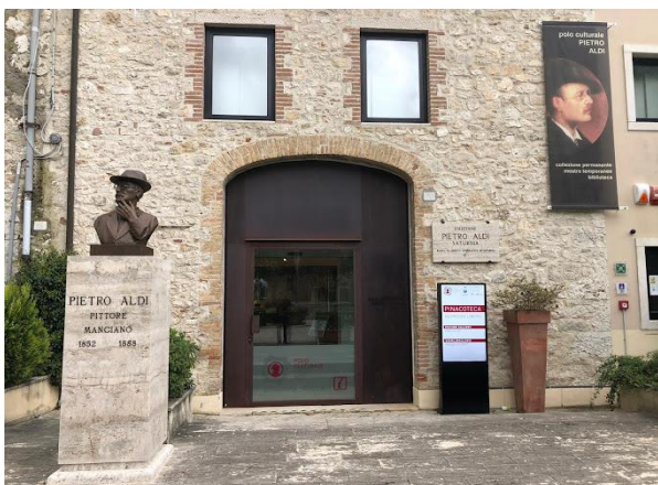
21 Ingresso Polo Pietro Aldi