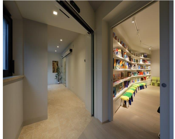
214 Polo espositivo