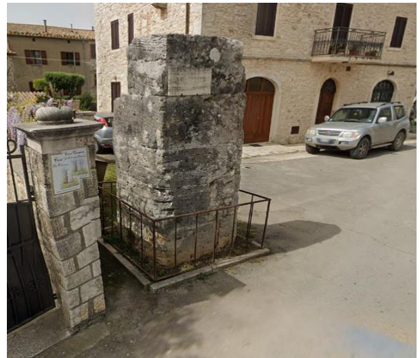
30 Rudere romano

Progetto realizzato con il contributo della