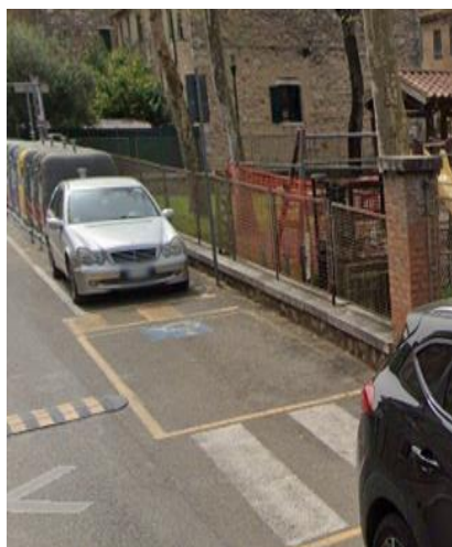
4 Parcheggio riservato