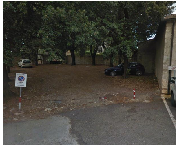
11 Tratto sterrato prima del Cannello della Rocca

Progetto realizzato con il contributo della