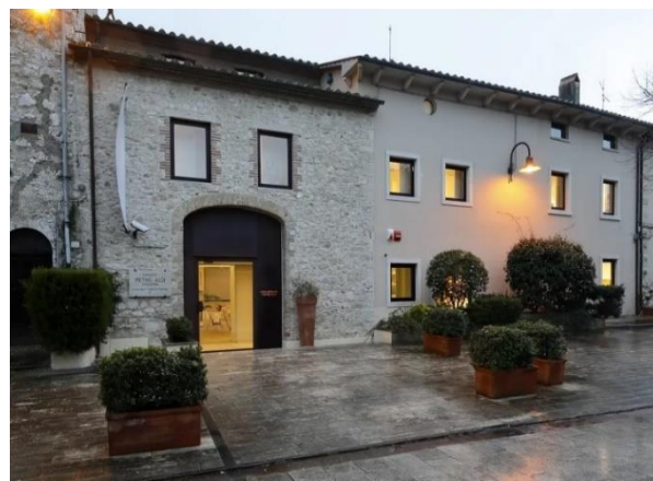
19 Polo Pietro Aldi

Il percorso espositivo interno risulta pulito, lineare e privo di ostacoli e pone in evidenza i temi principali dell'opera dell'artista maremmano, che nella seconda metà dell'Ottocento si formò alla scuola senese di Luigi Mussini. Nella sua breve vita (1852-1888) Aldi, ebbe fama per la pittura di storia, dal Medioevo al Risorgimento, ma la sua vena eclettica si manifesta anche nei numerosi ritratti, connotati da una particolare attenzione alla realtà.