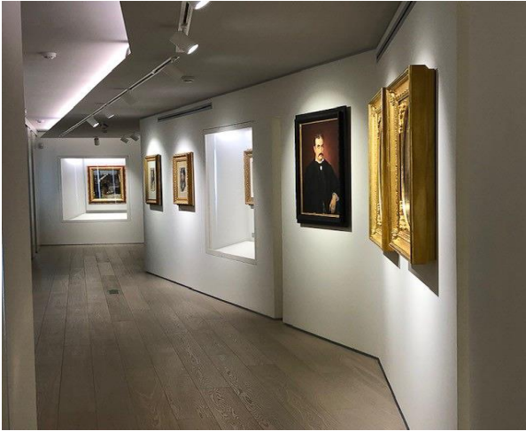
20 Polo espositivo