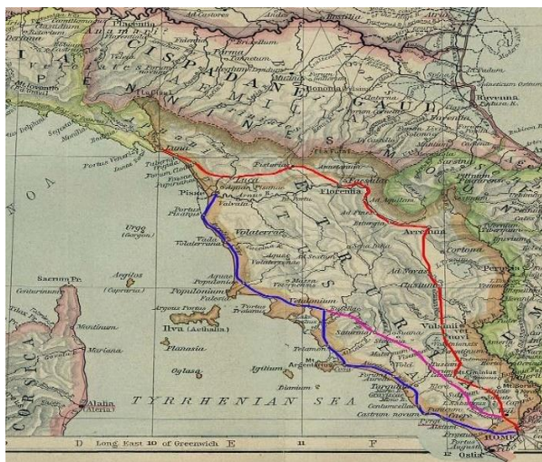
155 la Via Clodia