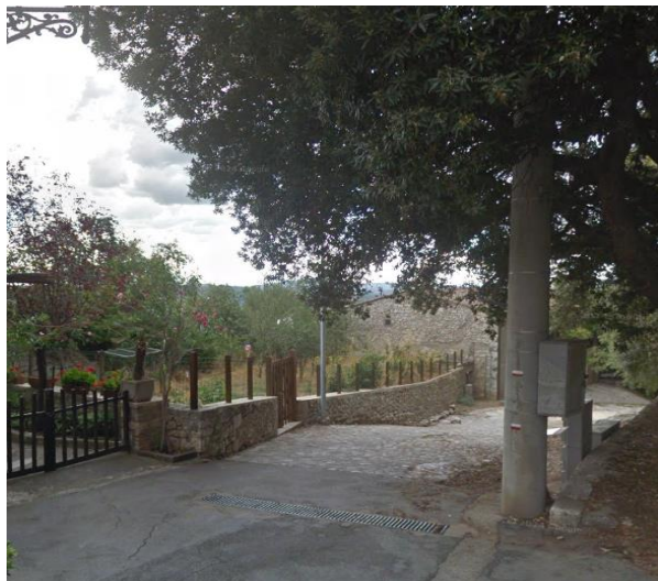
Figura 13 Percorso verso la Porta Romana

Scendendo verso la Porta Romana il percorso risulta molto sconnesso e con rampa di circa 30 metri con pendenza variabile dal 7.5% al 20% quindi si consiglia di ammirare il sito archeologico dal punto più stabile (un po' prima della casa in pietra, sulla sinistra)