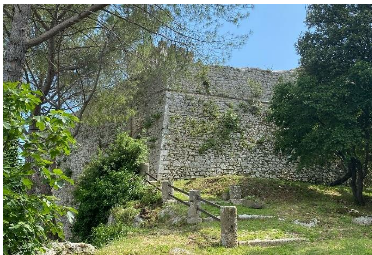
12 Rocca Senese

Da qui si torna indietro in direzione della Chiesa, voltando a destra. Il percorso prima in asfalto diventa ad un certo punto basolato.