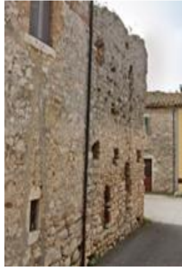
28 ruderi romani25