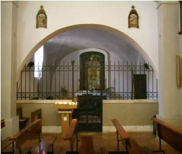
10 Cappella della Vergine

Per raggiungere la cancellata della vecchia Rocca senese, si cammina su un tratto in asfalto e un ulteriore tratto in sterrato abbastanza regolare e bene battuto.