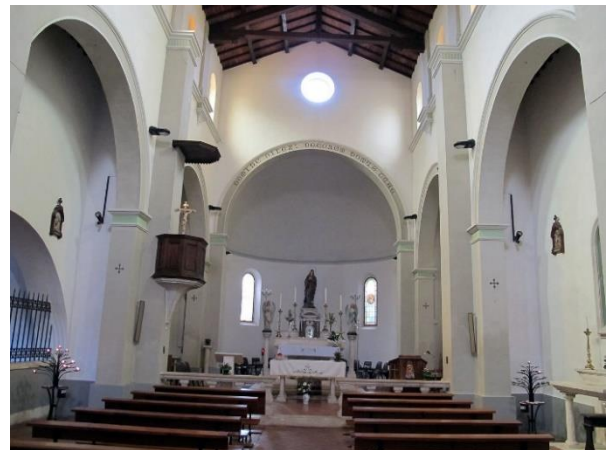
9 interno chiesa

Progetto realizzato con il contributo della