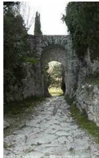
144 Porta Romana