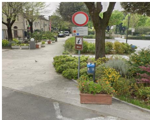
5 ingresso Piazza V. Veneto