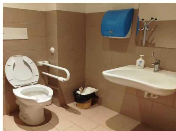
32 wc con maniglione26

Progetto realizzato con il contributo della