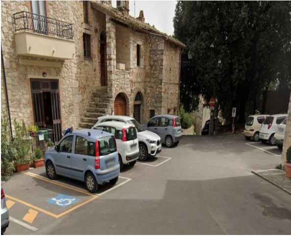
6 Posto riservato parcheggio di fronte alla chiesa