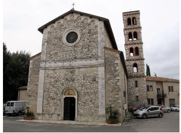
7 Facciata chiesa S. Maria Maddalena e portale di ingresso